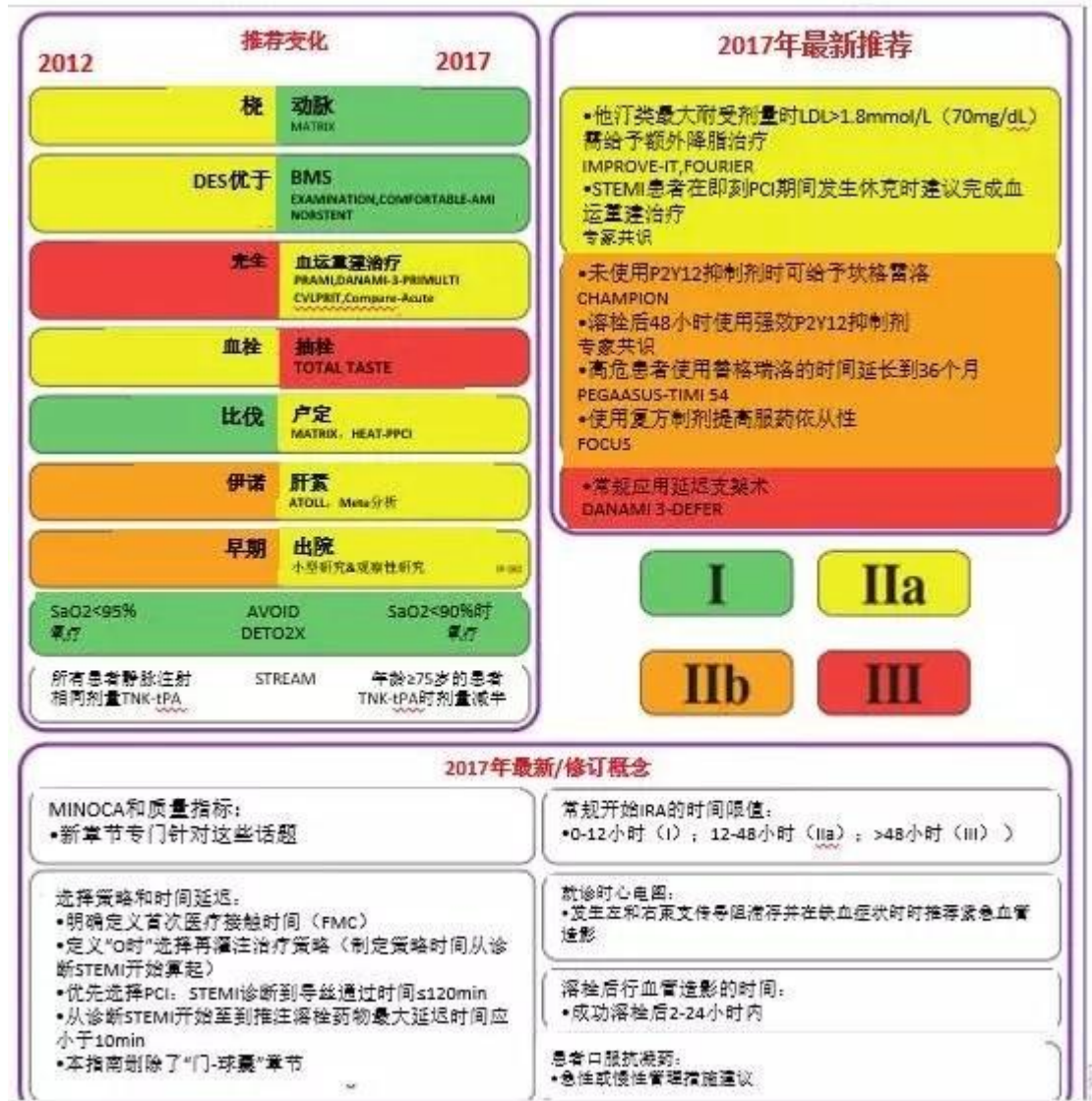
图 1 2017AMI-STEMI 指南更新